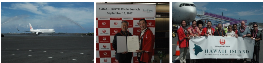
<コナ国際空港での就航セレモニーの様相>

JALは引き続き、お客さまの利便性、快適性の向上を目指し、さらなるネットワークの拡充、商品・サービス品質の向上にチャレンジしてまいります。